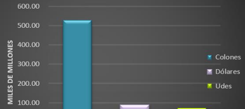
Distribución de la cartera por moneda