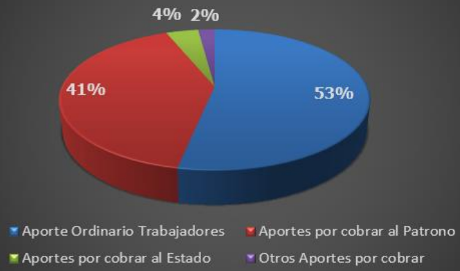
Distribución de los Aportes por cobrar