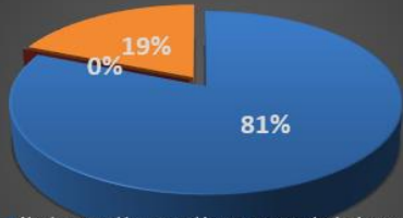
Distribución de la cartera por Modelo