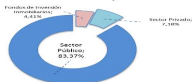
Gráfico N°2. Conformación por Sector del Portafolio de Inversiones con respecto del activo total de FJPPJ. Según el Valor de Mercado al 31 de julio de 2019.