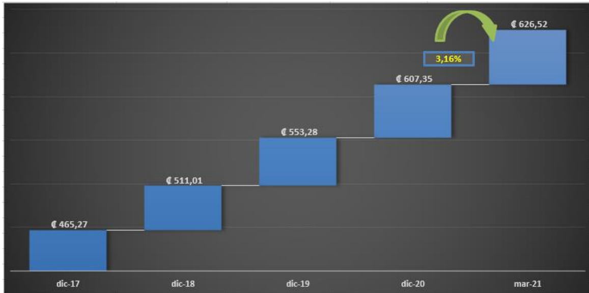
Gráfico 1 Valor Facial de Cartera Datos al 31 de marzo 2021 (En miles de millones de colones)