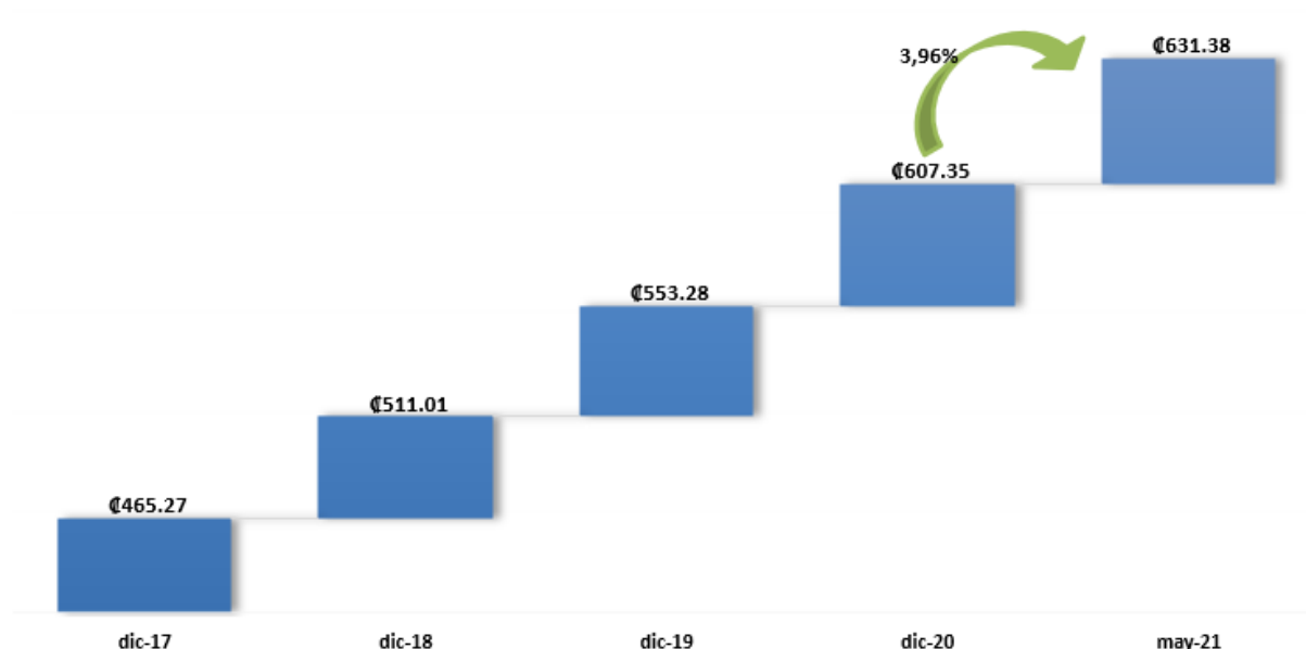
Gráfico 1 Valor Facial de Cartera Datos al 31 de mayo 2021 (En miles de millones de colones)