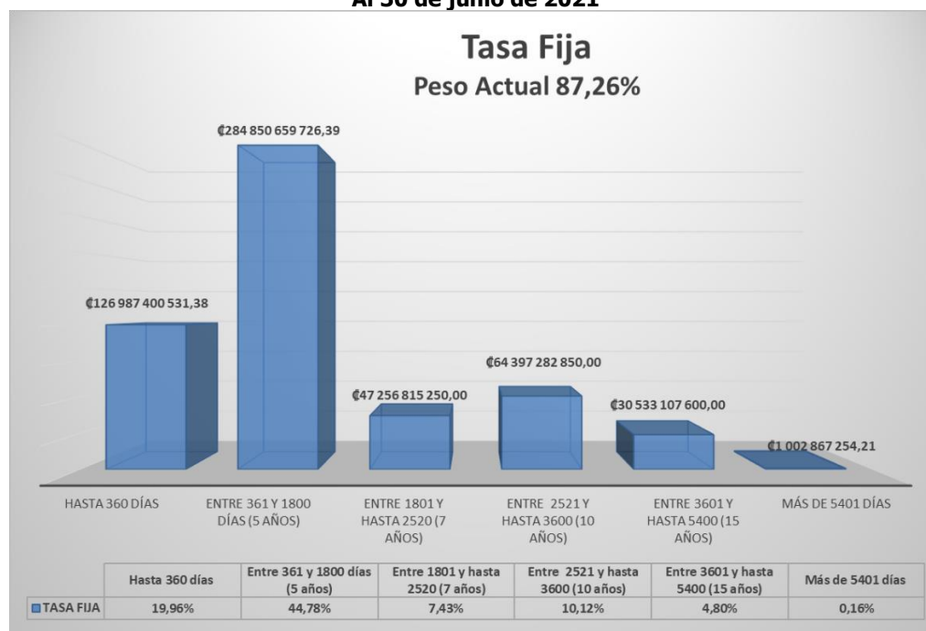
Gráfico N° 2 Pesos relativos para títulos de renta fija Al 30 de junio de 2021