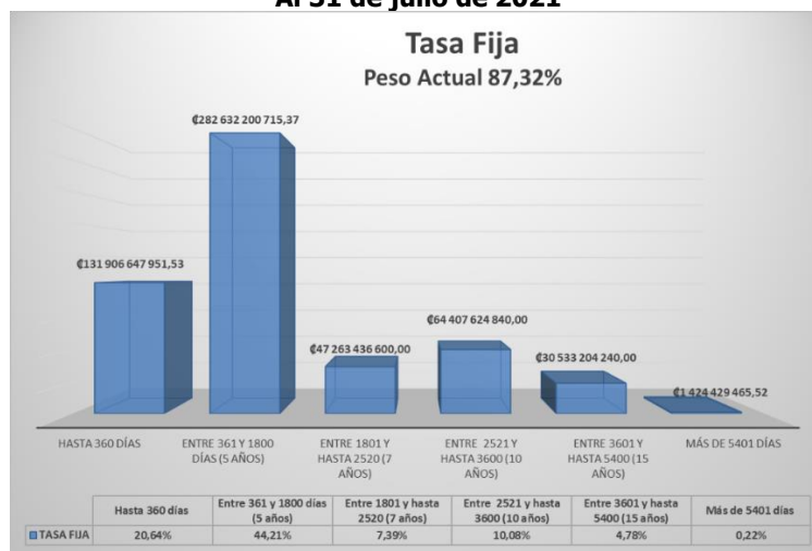
Gráfico N° 2 Pesos relativos para títulos de renta fija Al 31 de julio de 2021