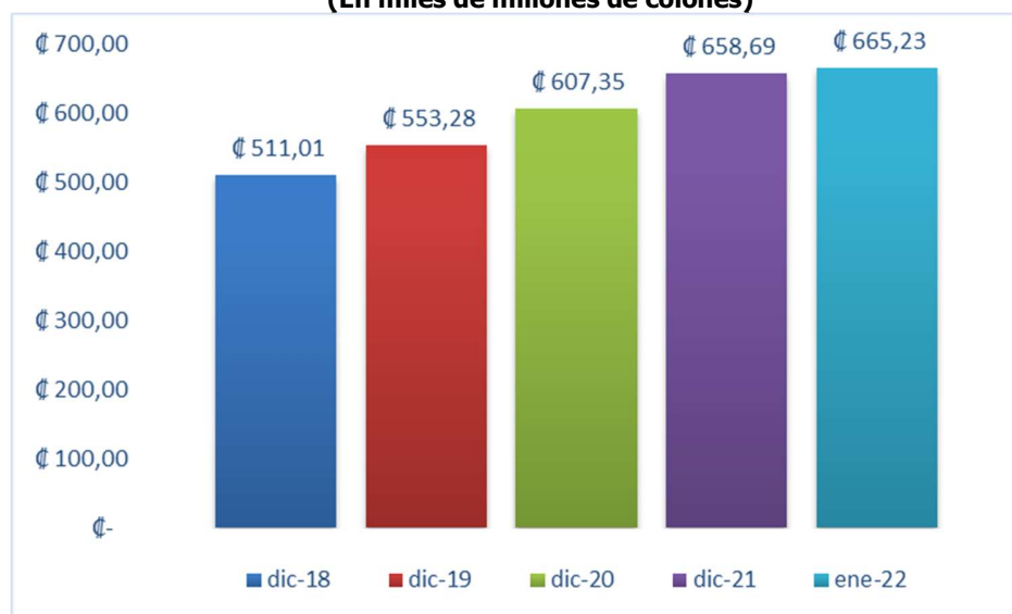
Gráfico 1 Valor Facial de Cartera Datos al 31 de enero 2022 (En miles de millones de colones)