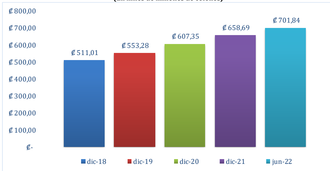
Gráfico 1 Valor Facial de Cartera Datos al 30 de junio 2022 (En miles de millones de colones)