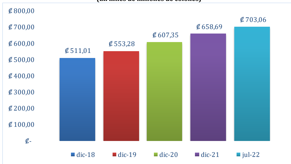
Gráfico 1 Valor Facial de Cartera Datos al 31 de agosto 2022 (En miles de millones de colones)