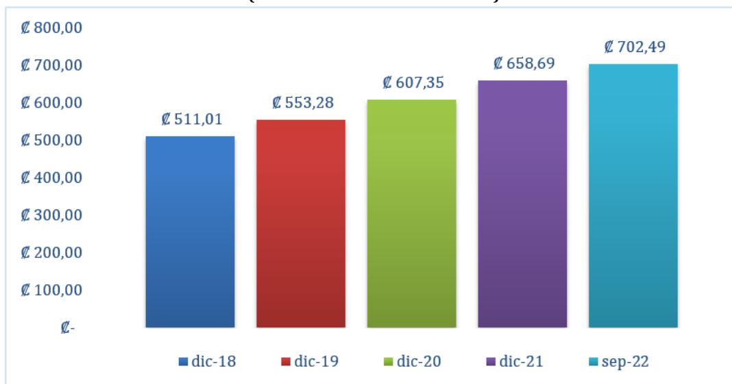
Gráfico 1 Valor Facial de Cartera Datos al 30 de setiembre 2022 (En miles de millones de colones)